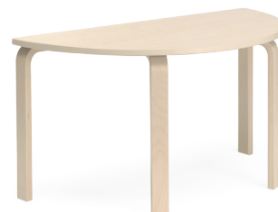
Kaar- või trapetslaud 120x60, kõrgus 72 cm; kase laminaadiga