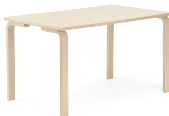
Laud 120x60; 120x80 cm, kõrgus 72 cm, kase laminaadiga