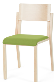
Öpetaja tool 16, iste polsterdatud