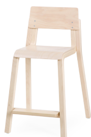
16 mini 50cm