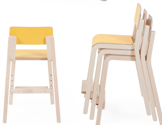
Jalatoe kõrgus reguleeritav 4-s astmes