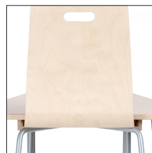
Toolri riputus (sobib tool 76-ga)