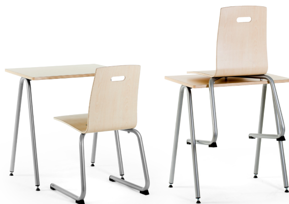
Sobib kokku koolitooliga 72