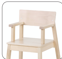
12 mini 50cm, KÄETUGEDEGA