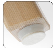
Vilttallad (paigaldatud tehases)