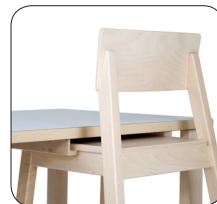
Lauaplaadi alla riputatav