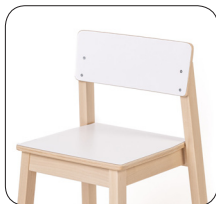
12 mini 50cm, LAMINAADIGA