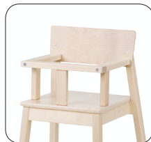
12 mini 50cm, KÄETUGEDE JA TURVAKAAREGA