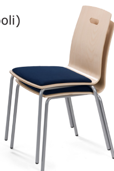
Virnastatav kuni 4 tooli

Tool on testitud ja vastab standardile EN 16139:2013 tase L1 (Mööbel. Tugevus, vastupidavus ja ohutus. Nõuded koduvälistele istmetele).