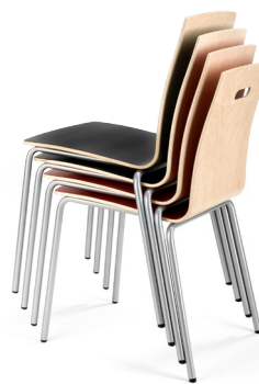
Virnastatav kuni 5 tooli