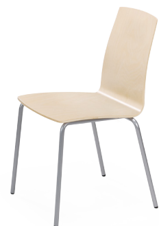
Tool 71 ilma tõsteavata