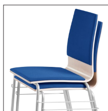
Virnastatav kuni 4 tooli